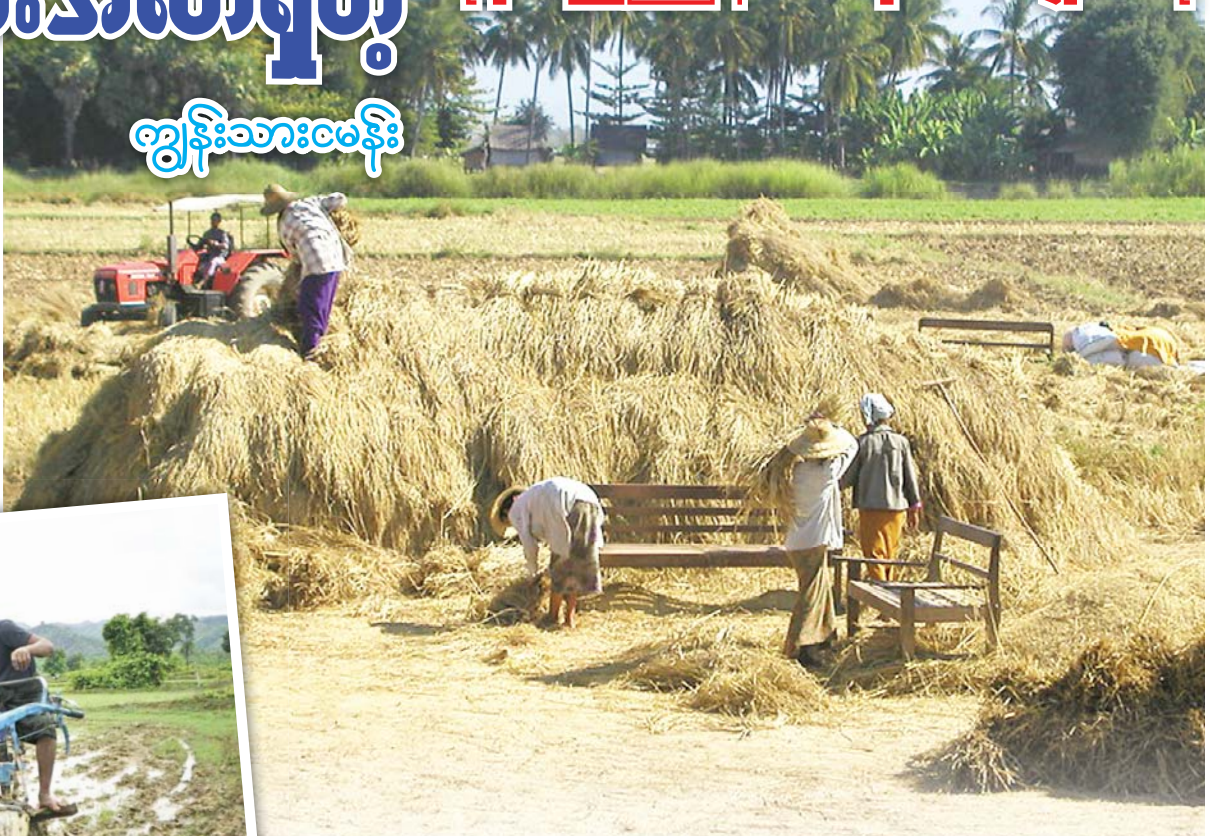
ကျွန်းသားဖေနီး

စာရေးသူဟာ စစ်တွေက မြို့ပြင်ကိုမထွက်ဖြစ်ခဲ့တာ ကြာပါပြီ။ နှစ်နှစ်လောက်တောင် ရှိခဲ့ပါပြီ။ နှစ်စဉ်သွား ရောက်ဖူးမျှော်မြဲဖြစ်တဲ့ မဟာမြတ်မုနိဘုရားဖူးခရီးတောင် မသွားဖြစ်ခဲ့တာပါ။ ၂၀၁၉ နှစ်ကုန်ပိုင်းလောက်မှာ စတင် ဖြစ်ပေါ်ခဲ့တဲ့ ကိုဗစ်-၁၉ ဆိုတဲ့ရောဂါဆိုးကြောင့် အိမ်တွင်း ကနေ အိမ်ပြင်မထွက်ရဆိုတဲ့အမိန့်ကြောင့် တစ်ကြောင်း၊ ရခိုင်ပြည်နယ်အတွင်းမှာ ဖြစ်ပျက်ခဲ့တဲ့ နှစ်ဖက်တိုက်ပွဲ တွေကြောင့် တစ်ကြောင်း ခရီးသွားလာဖို့အတွက်ကို ချုပ်တည်းနေခဲ့ရတာပါ။ ဒါပေမယ့်