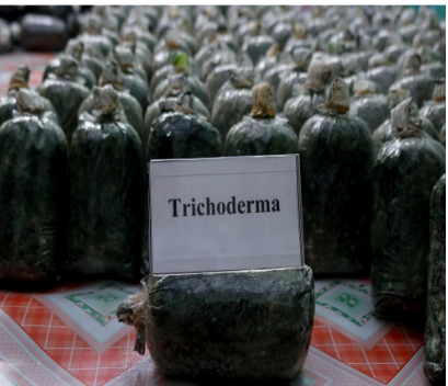
ထရိုင်းဒိုဒီးမားမိုထုတ်