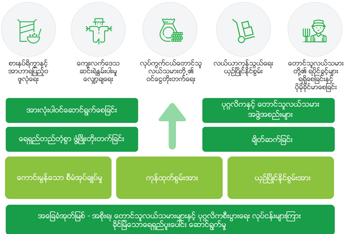
ပုံ ၁ - ADS ၏ မဟာဗျူဟာမူဘောင်

ရလဒ်များ။ အားလုံးပါဝင်ဆောင်ရွက်နိုင်သော၊ စဉ်ဆက်မပြတ်သော၊ ကဏ္ဍပေါင်းစုံပါဝင်သော၊ ချိတ်ဆက်မှုများကို အခြေခံသော ဖွံ့ဖြိုးတိုးတက်မှုကို အရှိန်အဟုန်မြှင့်ခြင်းဖြင့် စားနပ်ရိက္ခာနှင့်အာဟာရဖူလုံမှု၊ ကျေးလက်ဒေသ ဆင်းရဲ နွမ်းပါးမှုလျော့ချခြင်း၊ ကျေးလက်အိမ်ထောင်စု များရှိ လုပ်ကွက်ငယ်တောင်သူလယ်သမားများ၏ ဝင်ငွေမြင့်မားလာမှု၊ စိုက်ပျိုးရေး ကုန်သွယ်မှုများ၏ ယှဉ်ပြိုင်နိုင်စွမ်းနှင့် လယ်သမားများ၏ ရပိုင်ခွင့်များ ပိုမိုခိုင်မာလာခြင်းတို့ ရရှိလာမည်ဟု မျှော်မှန်းထားပါသည်။ ပုံ ၁ တွင် ADS ၏ မဟာဗျူဟာမူဘောင်ကို ပုံဖြင့် ဖော်ပြထားပါသည်။