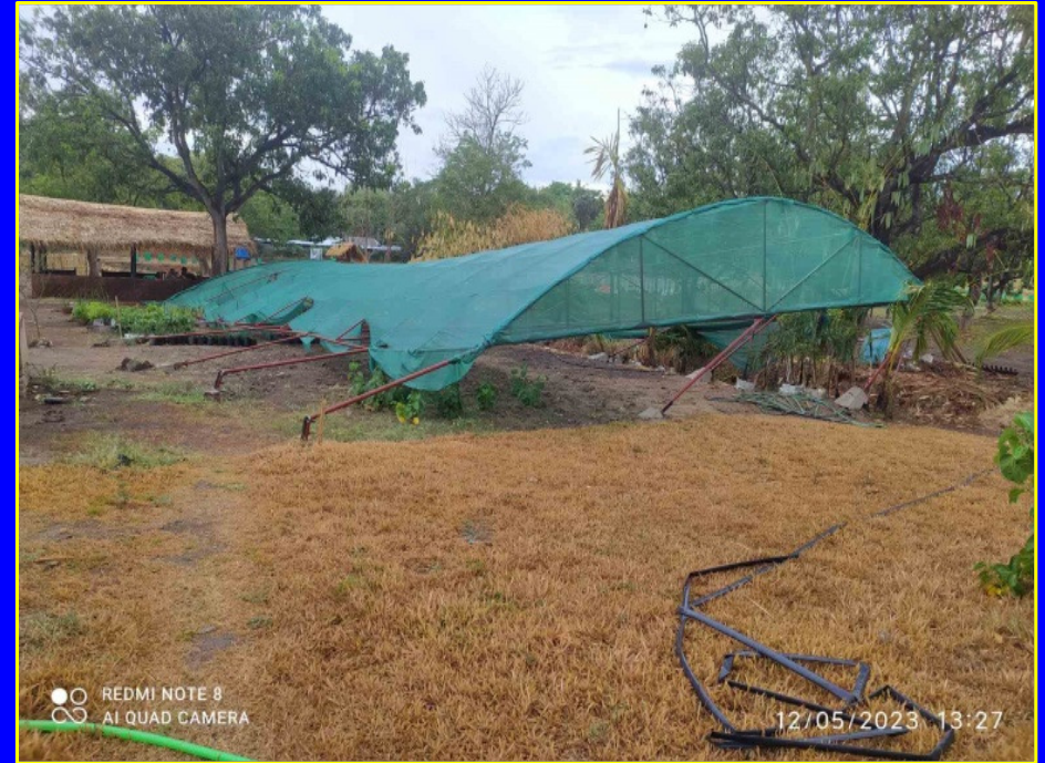
ပရဆေးပျိုးခြံ Net House အဆောက်အဦးတစ်ခုလုံးပြိုကျခြင်း