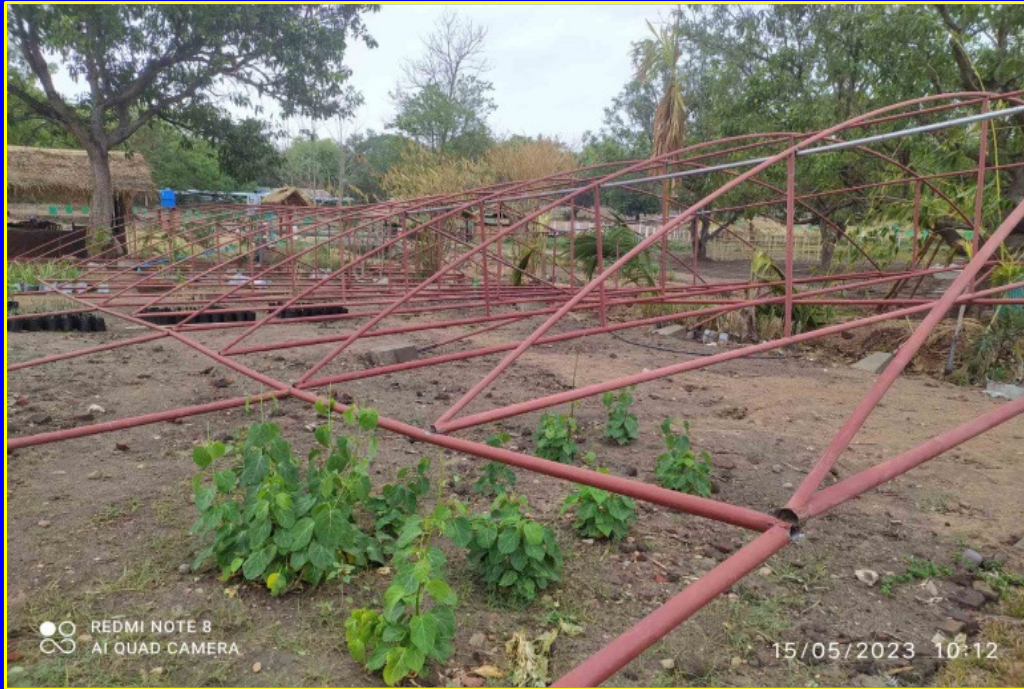
ပရဆေးပျိုးခြံ Net House ခေါင်မိုးလန်ခြင်း